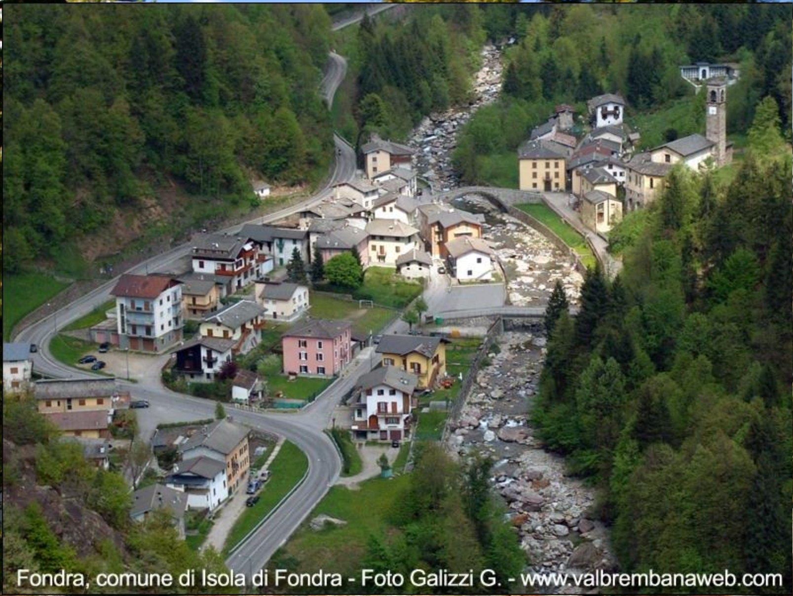
Fondra, comune di Isola di Fondra