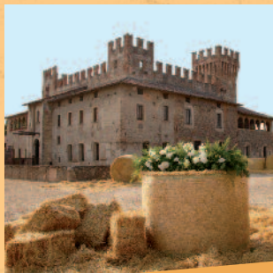
Castello di Malpaga