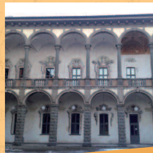
Palazzo visconteo di Brignano