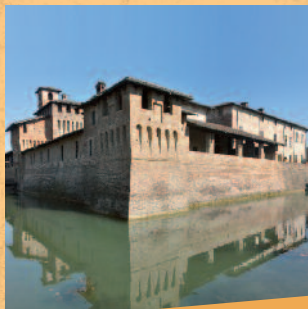
Castello di Pagazzano