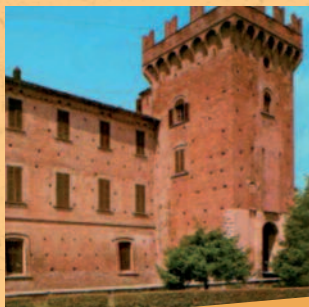
Rocca di Urgnano