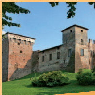
Rocca di Romano di L.