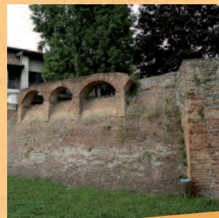
Borgo di Cologno al Serio