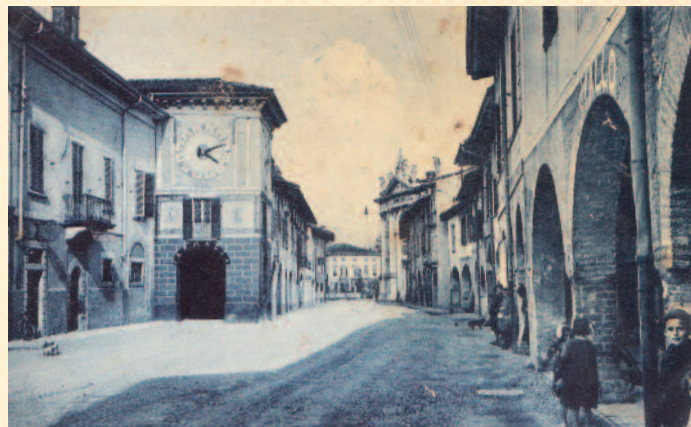
Anni 40: via Tadino stranamente semideserta con alcuni curiosi che sono accorsi "come spesso accadeva in quegli anni" per farsi immortalare dal fotografo. E sullo sfondo la facciata di villa Allegreni