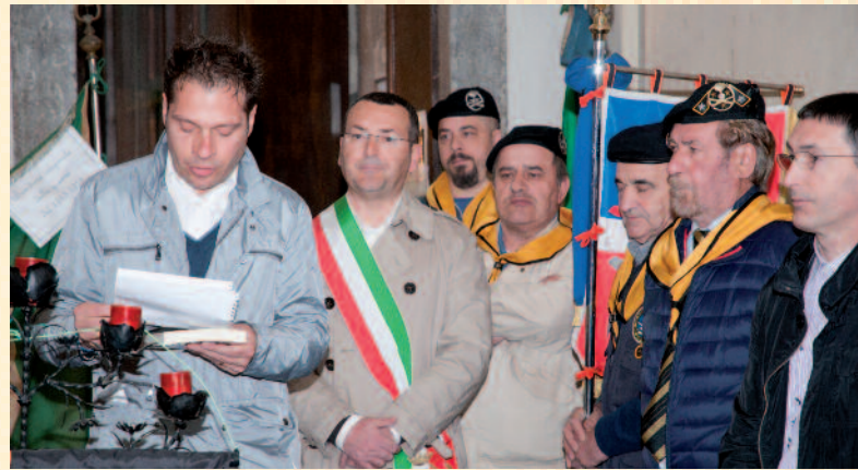
Il presidente Pro Loco e il sindaco di Martinengo

Da questo punto di vista è allora facile capire quanto sia stata encomiabile l'iniziativa dei promotori della mostra "II Guerra Mondiale... nella nostra memoria", che si è svolta dal 23 aprile al 1 maggio scorsi nel Monastero di S. Chiara, grazie anche alla disponibilità offerta dall'Amministrazione Comunale. Abbiamo un debito di riconoscenza verso la Pro Loco martinenghese e tutte le locali associazioni d'arma, in particolare gli Artiglieri e i Carabinieri, che hanno organizzato e gestito questo evento salutato da una grande affluenza di cittadini, evidentemente stimolati dall'idea di ritrovare i propri lontani parenti e compaesani fissati in ricordi fotografici, lettere, ritagli di giornali, uniformi belliche e attrezzature dell'epoca. Immagini e ricordi di un momento cruciale, quello in cui sono stati chiamati a un sacrificio, volenti o nolenti, ma anche quello in cui hanno saputo trovare una via di riscatto individuale e collettivo nei giorni turbolenti e pieni di speranza della Liberazione. La ricca mostra con il suo abbondante apparato iconografico è stata davvero una bella oc-