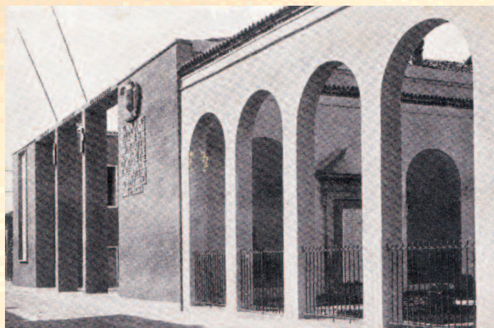
Via Allegreni anni 40 parte dell'attuale Sacrario dei Caduti e facciata della casa littoria con visibili i fasci littori un'aquila e sotto la scritta "Nel nome di Dio e dell'Italia giuro di eseguire gli ordini del Duce e di servire con tutte le mie forze e se è necessario col mio sangue la causa della rivoluzione fascista".