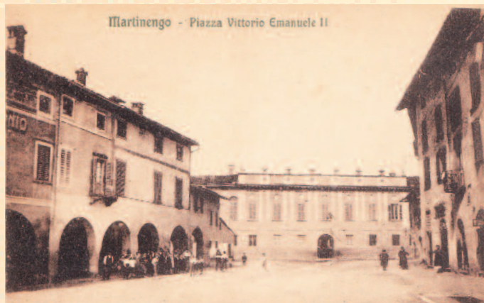
La bella piazza Vittorio Emanuele ora piazza Maggiore animata