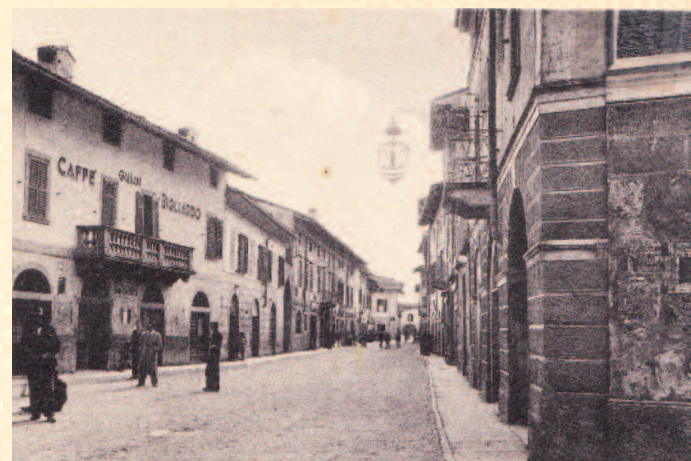
Anni 40: via Tadino ora via Locatelli, si vede in alto l'insegna di sant'Antonio e sulla sinistra il GALLIANI Caffè Bigliardo.